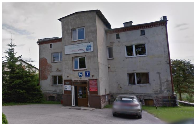
Fotografia 9. Budynek Miejsko-Gminnego Ośrodka Pomocy Społecznej