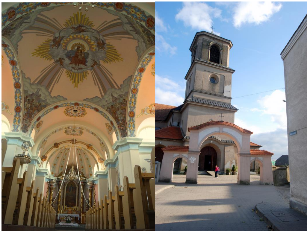
Fot. 13., 14 . Kościół pw. św. Mikołaja i NMP w Mroczu