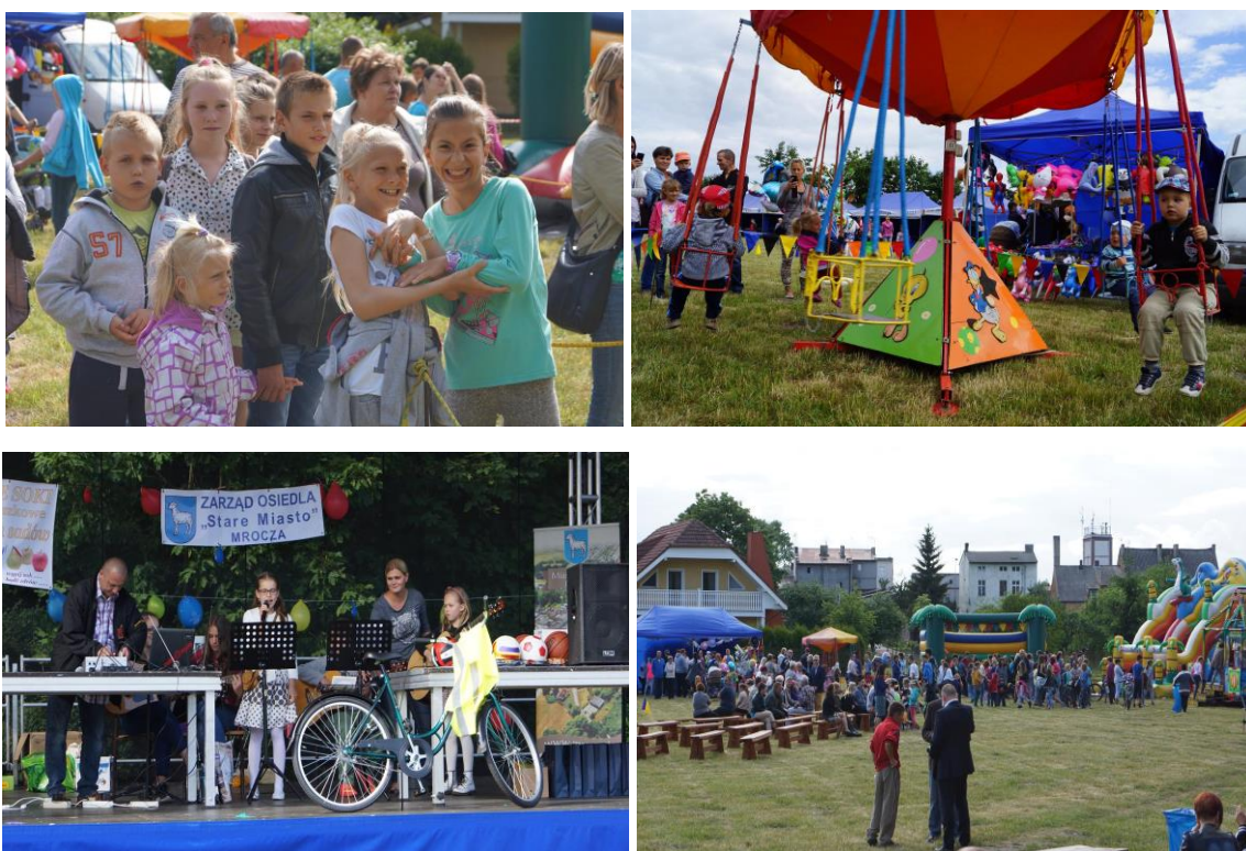
Fotografia 3, 4, 5, 6 Festyn rodzinny „Powitanie Lata”