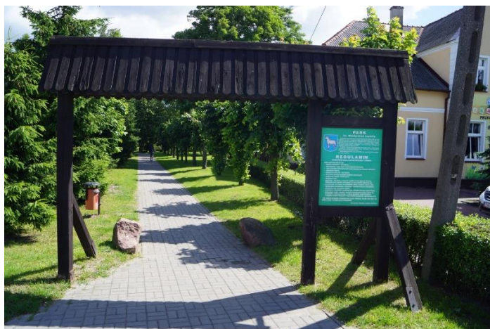
Fotografia 2. Wejście do Parku im. Władysława Jagiełły – Osiedle Stare Miasto Mrocza

Park to idealne miejsce do odpoczynku. Wymaga renowacji, która polegać ma na budowie ścieżki rowerowej łączącej centrum miasta z obwodnicą oraz jeziorem Hetmańskim, budowie miejsc aktywnego wypoczynku (Otwarte Strefy Aktywności- plac zabaw, siłownia zewnętrzna, strefa relaksu, itp.), toalety publicznej, ławek, oświetlenia, monitoringu, obiektów gastronomicznych, itp. Realizacja w/w przedsięwzięć pozwoli tak zagospodarować teren parku, aby stał się on atrakcyjnym miejscem spędzania czasu wolnego przez wszystkich mieszkańców (i nie tylko) w różnym wieku.