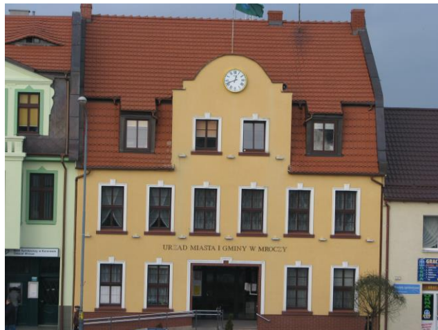
Fot. 11. Budynek Urzędu Miasta i Gminy w Mroczy