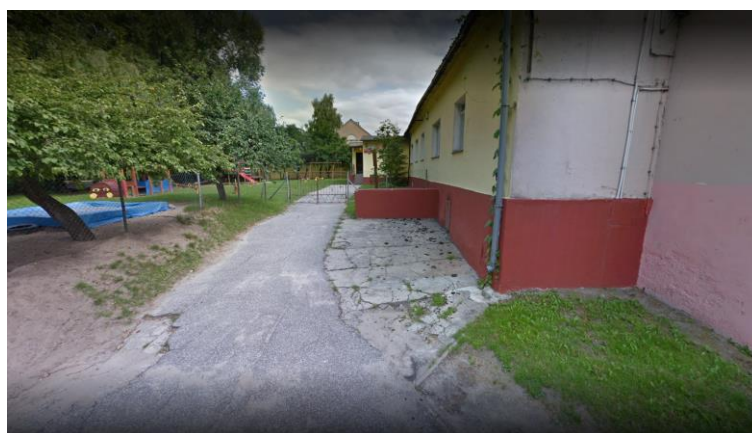
Fotografia 10. Budynek Przedszkola Miejskiego

Z uwagi na zły stan techniczny pomieszczeń, niedostosowanie do potrzeb oraz zbyt duże nakłady finansowe na wyremontowanie oraz dostosowania obiektu do obowiązujących norm opracowano dokumentację techniczną na budowę nowego budynku Przedszkola Miejskiego, które ma być zlokalizowany przy kompleksie budynków Szkoły Podstawowej w Mrocz.