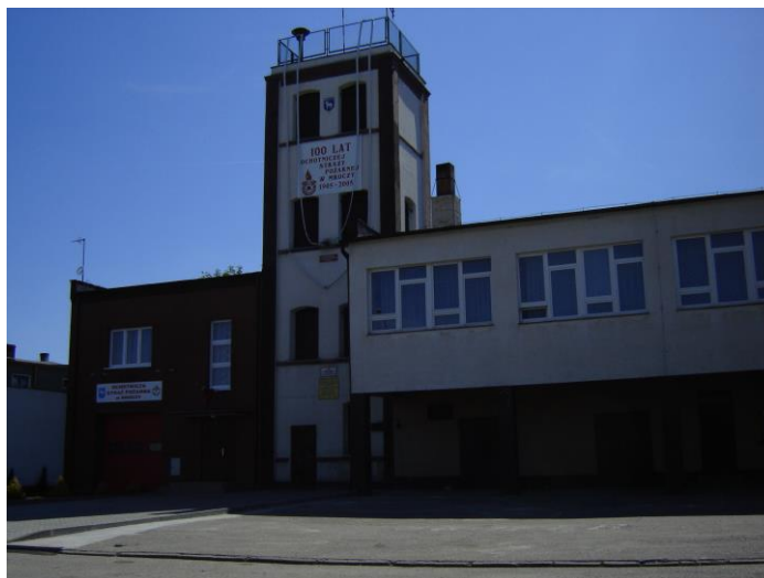
Fot. 12. Remiza OSP w Mroczy

Zabytkowy kościół parafialny pod wezwaniem św. Mikołaja postawiono w XIV wieku. Obecna świątynia została wybudowana w latach 1930-1932 w stylu barokowym według projektu architekta Soczkiewicza. Pracami budowlanymi kierował budowniczy Jarocki z Bydgoszczy. Jest to budowla murowana, neobarokowa o pięciu nawach. Wyposażenie wnętrza pochodzi z poprzednich świątyń, w większości reprezentuje styl barokowy. W 1939 świątynia została zamknięta przez hitlerowców, a księża otrzymali areszt domowy. Wskutek działań wojennych w latach 1939 - 1945 świątynia parafialna w znacznej części została zniszczona. W kolejnych latach parafianie odbudowali swój kościół. Po wojnie świątynia została gruntownie odnowiona i odbudowana. W 1955 roku zostało założone ogrzewanie w świątyni, natomiast rok później została położona nowa posadzka i zostało ustawione nowe pancerne tabernakulum. W 1963 roku kościół został uroczystie konsekrowany. Uroczystości przewodniczył ówczesny sufragan gnieźnieński ks. bp. Lucjan Bernacki. W 1971 roku w świątyni została zainstalowana nowa droga krzyżowa oraz tablice pamiątkowe dla budowniczych świątyni. W 1981 został poświęcony nowy krzyż misyjny. Na przestrzeni ostatnich lat renowacji poddane zostały malowidła ściennie w świątyni, wymieniono ogrzewanie oraz nagłośnienie oraz wykonano remont elewacji kościoła. Ponadto wyremontowano budynek plebanii oraz wikariatu.