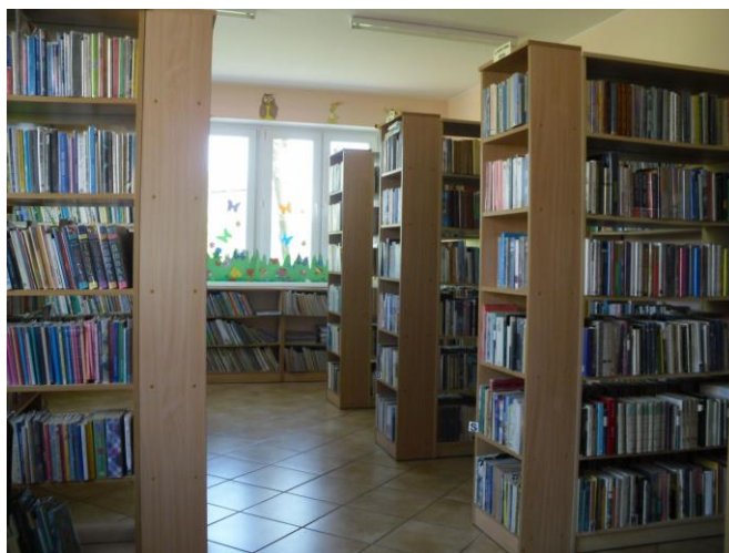
Fotografia 8. Pomieszczenia Miejsko-Gminnej Biblioteki Publicznej w Mroczy

czytelników w roku 1976 otwarto nowy lokal, w którym zlokalizowano bibliotekę dla dorosłych. Nowy lokal znajdował się przy Placu 1 Maja, a w starym pomieszczeniu utworzono filię dziecięcą. Lata 90-te przyniosły zmiany w strukturze bibliotek. Na mocy ustawy o Samorządach Terytorialnych obowiązek utrzymania i prowadzenia bibliotek spoczął na gminach w ramach zadań własnych. Skutkiem tego w 1991r. zamknięto filię dla dzieci. Część księgozbioru przekazano do bibliotek szkolnych, a część dołączono do biblioteki dla dorosłych. W 1992r. Miejsko-Gminną Bibliotekę Publiczną przeniesiono do pomieszczeń Ośrodka Kultury. Tym samym stała się ona częścią jego struktur organizacyjnych. Taki stan rzeczy miał miejsce do roku 2009, w którym ponownie rozdzielono placówki. Niestety za zmianami organizacyjnymi nie poszły zmiany lokalowe. Biblioteka nadal zajmuje pomieszczenia MGOKiR przy ul. Śluzowej 6, które pozostawiają wiele do życzenia. Z uwagi na poszerzenie oferty MGBP o organizację imprez o charakterze kulturalnym i edukacyjnym obecnie zajmowane pomieszczenia są ciasne i niedostosowane do aktualnych potrzeb.