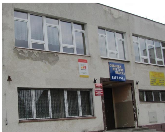
Fotografia 7. Budynek Miejsko-Gminnego Ośrodka Kultury i Rekreacji w Mroczy

Budynek Miejsko-Gminnego Ośrodka Kultury i Rekreacji w Mroczy zlokalizowany jest przy ul. Śluzowej 6 w Mroczy. Pomieszczenia MGOKiR stanowią część budynku w którym znajduje się również Biblioteka Publiczna oraz Remiza Ochotniczej Straży Pożarnej. W budynku przy ulicy Śluzowej działają różnego rodzaju sekcje: muzyczna, plastyczna, teatralna, szachowa i taneczna. Swoją działalność realizuje Teatr Bajzel, zespół Big Band, Zespół muzyczny uczniów Szkoły Podstawowej oraz Gimnazjum, zespół folklorystyczny „Mroczańki”. W obiekcie odbywają się zajęcia nauki gry na gitarze, płaskorzeźby, animacyjne i plastyczne. Ponadto odbywają się imprezy okolicznościowe oraz spotkania Klubu Seniora, Koła Kombatantów oraz Koła Gospodyń Wiejskich w Mroczy. Na chwilę obecną obiekt wymaga przebudowy oraz dostosowania do istniejących potrzeb m.in.: w dostosowaniu do użytkowania przez osoby niepełnosprawne, remont dużej sali (parkiet, nagłośnienie, oświetlenie, wentylacja i klimatyzacja), wyodrębnienie pomieszczeń pełniących funkcję pracowni, wyodrębnienie i wyposażenie kuchni, szatni, toalet, itp.