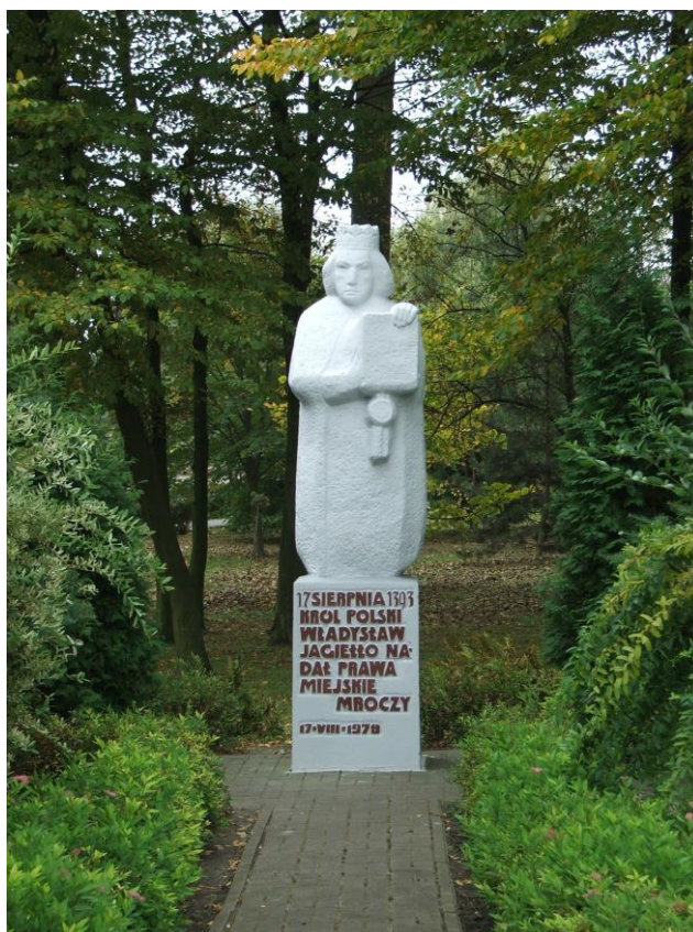
Fotografia 1. Pomnik króla Władysława Jagiełły

wydarzenia w Mroczy stanął pomnik króla, a park w którym się znalazł nazwany został imieniem władcy.